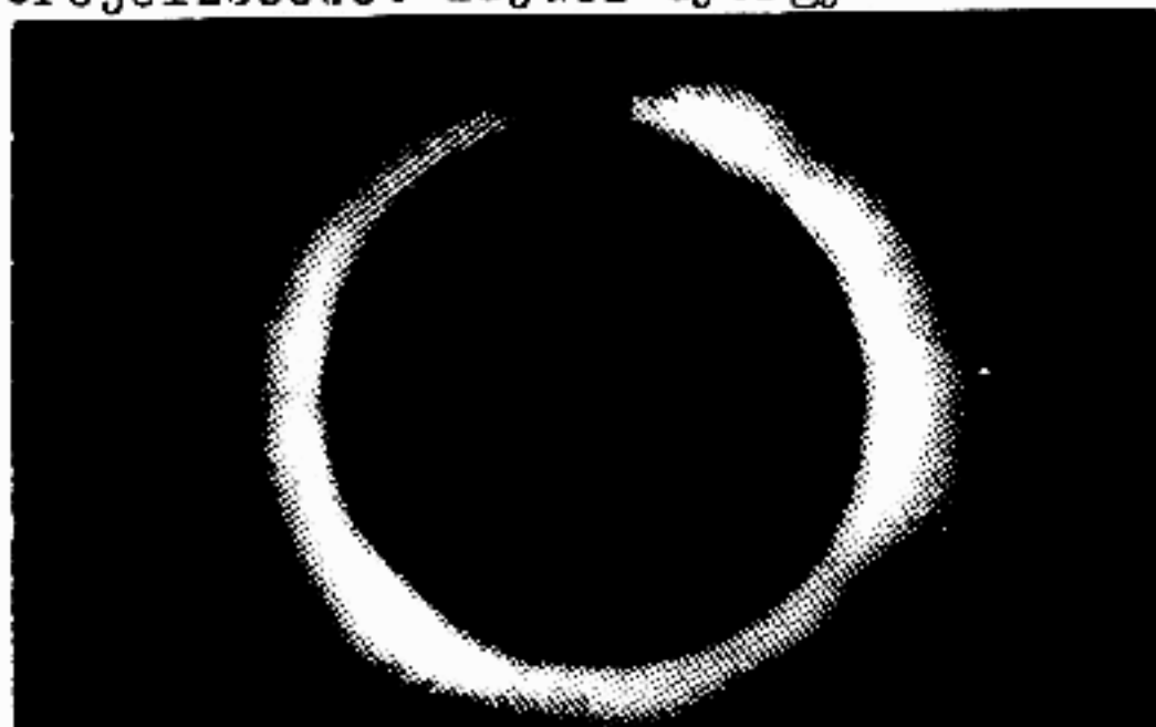
Az "évszázad napfogyatkozása" 1991. július 11.-én.

D -belépés, R -kilépés, PA -pozíciósög, h -horizont feletti magasság Az előrejelzéseket Zajác György készítette.